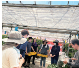
中村農園での農作業。収穫したいちごでジャムづくり。

サロンや工房に集って生まれる「安心」や「楽しい」もありますが、時にぶつかり、傷つけあうこともあります。利用者もスタッフも苦しくなるときもあります。深い傷つきを抱えたひとたちが安心して居られる場所づくりは、とても大切で、とても難しいことです。