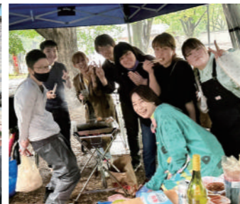
ゆずりは工房メンバーでのバーベキュー。喧嘩しても仲よし。